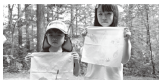
ネイチャープリント